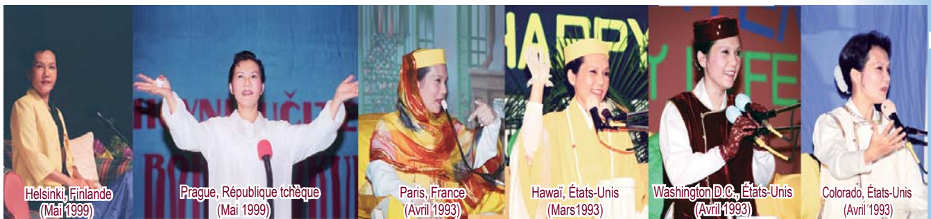
Helsinki, Finlande (Mai 1999)