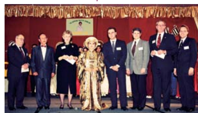
Le Maître et les représentants des gouverneurs de six États Chicago, États-Unis (22 février 1994)

2. « Son organisation combinera les meilleurs éléments de l'église et de l'État pour nourrir les affamés... »